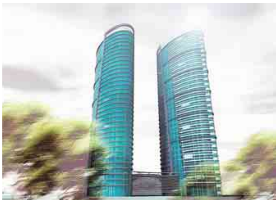
Οι δίδυμοι ουρανοξύστες που προβλέπεται να χτιστούν στην περιοχή

Σήμερα, στην ευρύτερη περιοχή του Πειραιά αναλογεί 1,5 τετραγωνικό μέτρο πράσινο ανά κάτοικο (στην Ευρώπη ο μέσος όρος πρασίνου